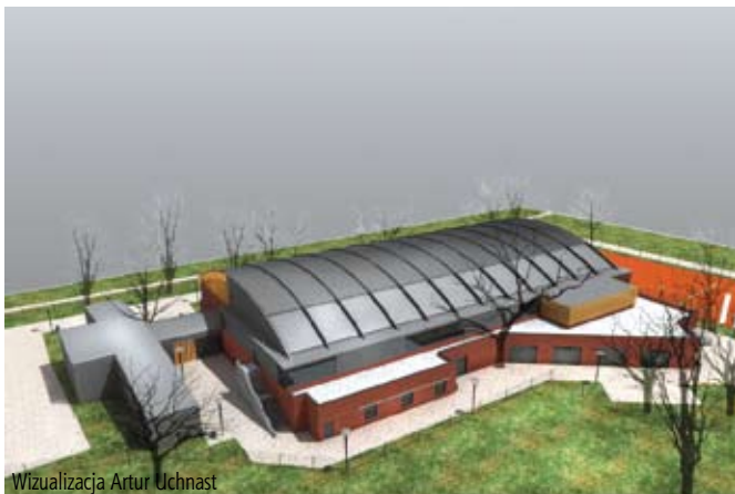
Wizualizacja Artur Uchnast