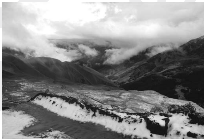
Zdjęcia z Gruzji