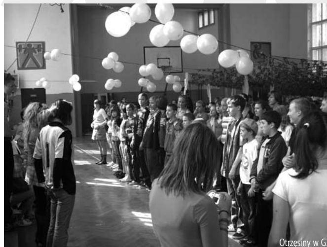
Otrzęsiny w G3