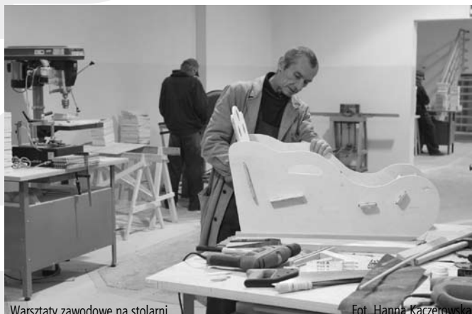
Warsztaty zawodowe na stolarni

Projekt miał na celu wspieranie oraz realizację działań zmierzających do włączenia do obywatelskiego uczestnictwa osób oraz środowisk, które na skutek transformacji są szczególnie zagrożone pozostawaniem na marginesie życia społecznego, ekonomicznego i politycznego.