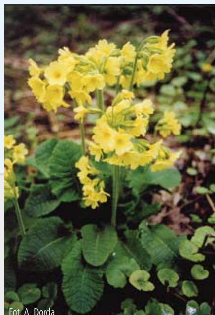
Fot. A. Dorda