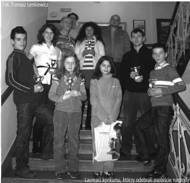
Laureaci konkursu, którzy odebrali osobiście nagrody